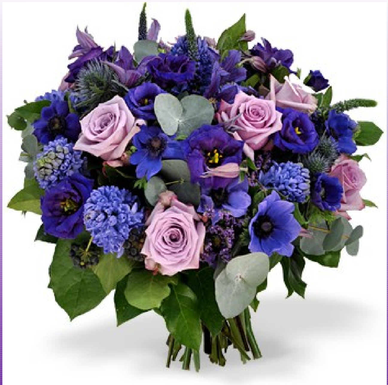
ALV Vereniging Dietisten Geriatrie en Ouderen 13-11-2015